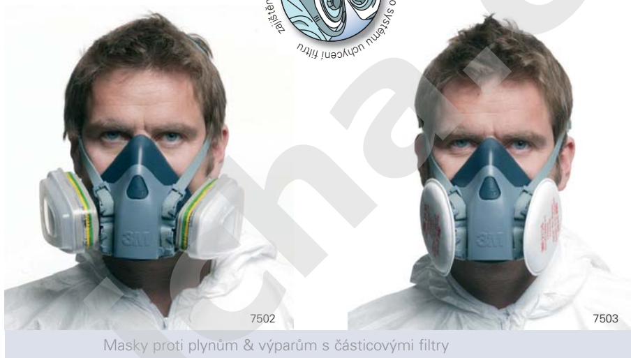
Masky proti plynům & výparům s částicovými filtry