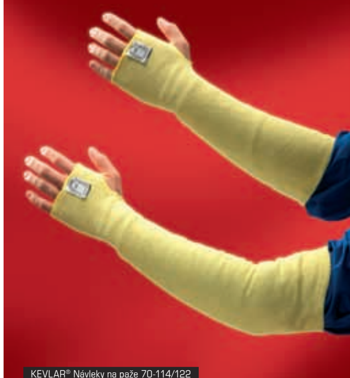
KEVLAR® Návleky na paže 70-114/122