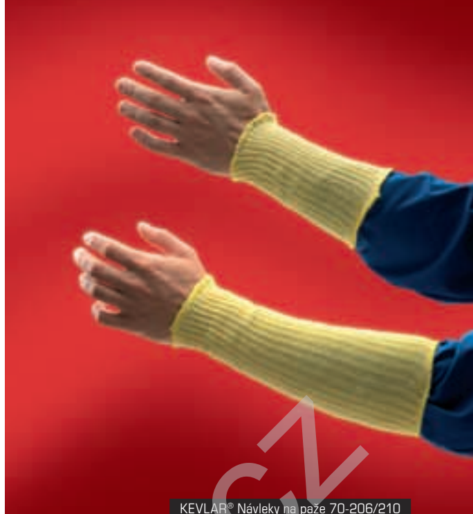
KEVLAR® Návleky na paže 70-206/210