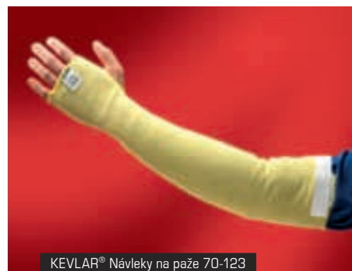
KEVLAR® Návleky na paže 70-123