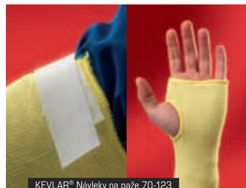
KEVLAR® Návleky na paže 70-123