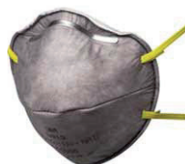
filtrační polomaska 9913