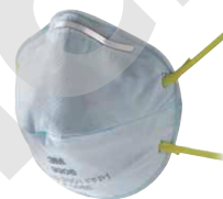
filtrační polomaska 9906