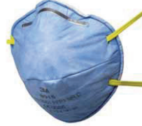
filtrační polomaska 9915