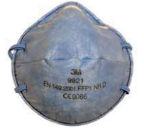
filtrační polomaska 9921