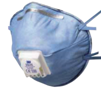
filtrační polomaska 9926