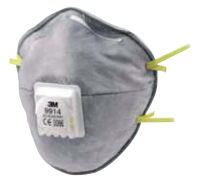
filtrační polomaska 9914